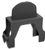
Demontagehilfe für H-469/1