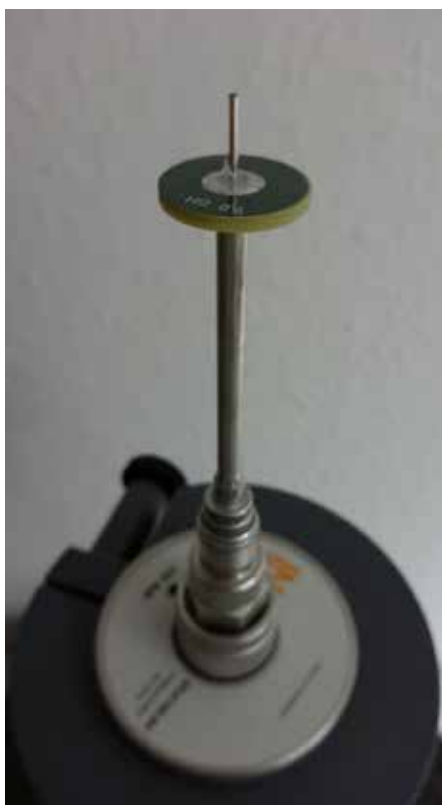
Monopol antenna a 9 GHz-es adóra csatlakoztatva

A GHz-es tartományú rádiókommunikáció fortélyait és az alkalmazható antennák kipróbálható, mérhető alaptípusait mutatja be a Lucas-Nülle „UniTrain-I” rendszerén belül az „Antenna technológia” kurzus. A 9 GHz környékén (veszélytelenül alacsony sugárzási teljesítménnyel) működő mérési összeállítás egy forgató mechanizmus segítségével képes még az iránykarakterisztika felvételére is (1-4. ábra)! Egy másik készlet az ún. ILA (Interaktív Labor