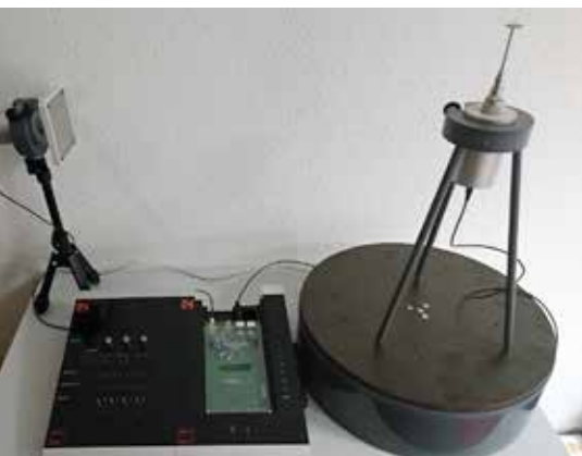
Mérsi elrendezés iránykarakterisztika felvételéhez

Egy szó, mint száz, hihetetlen tempóban fejlődik a technológia, nő a beépített eszközök mennyisége és bonyolultsága, így egyre több szakember kell, aki ezeket az eszközöket érti, kezeli, intelligensen alkalmazza, esetenként pedig javítani és továbbfejleszteni is képes. Ezen bonyolult készülékeknek és rendszereknek az oktatása – már a középszintű műszaki szakképzéstől kezdődően – megkívánja a legkorszerűbb oktatási segédeszközök, demonstrációs és oktató rendszerek használatát is.