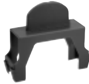
Demontagehilfe für H-468