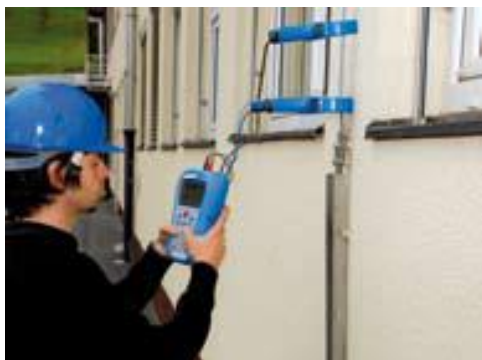
Két lakatfogós mérési módszer