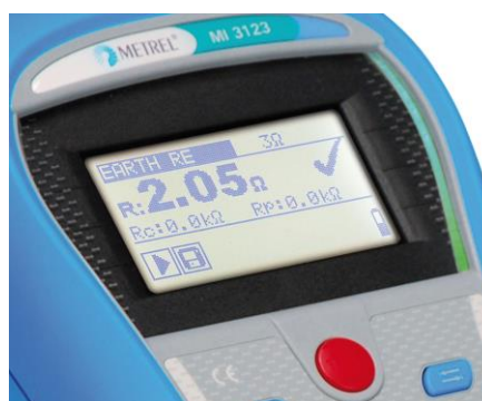
Fényes zöld és piros LED-sor