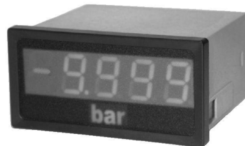
A kép csak illusztráció.