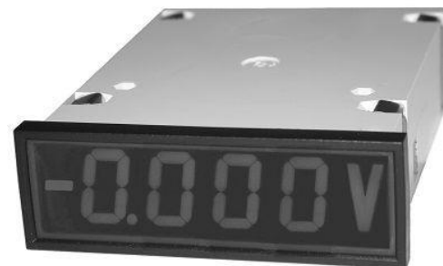
A kép csak illusztráció.