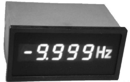
A kép csak illusztráció.