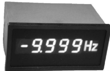
A kép csak illusztráció.