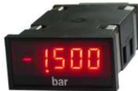
A kép csak illusztráció.